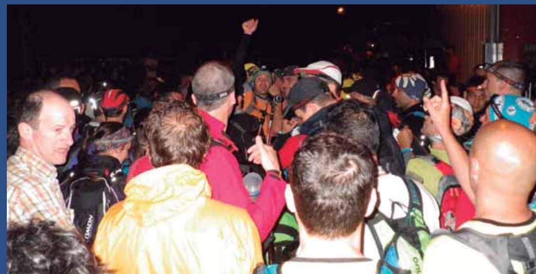
Argazkia: Juanan Gutiérrez.

Iturria: Manuel Iradier Txangolari Elkarteak.